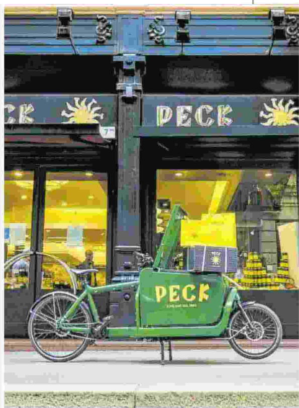
▲ Delivery Peck consegna a domicilio colombe classiche e uova decorate